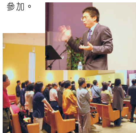
馮博士在演講及聽眾