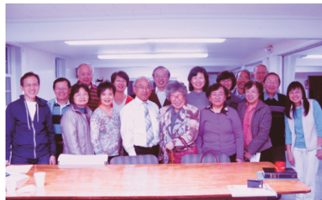
曾在美國華人教會事奉

多年來，自己有句座右銘：為己作事要自量，為神作事卻要盡量（盡量大，盡量多，盡量好）。若盼望自己可以為主成就一些事工，我們當學習：勿求適合自己（有限）力量的工作；當求適合（委托）工作的力量。我想，這樣作符合耶穌所說“信祂的人，要作比祂在世時更大的事”之應許吧。（約14:12）